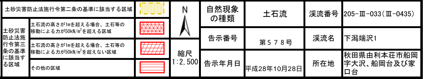
様式-2 (土) 土砂災害警戒区域・土砂災害特別警戒区域 区域図