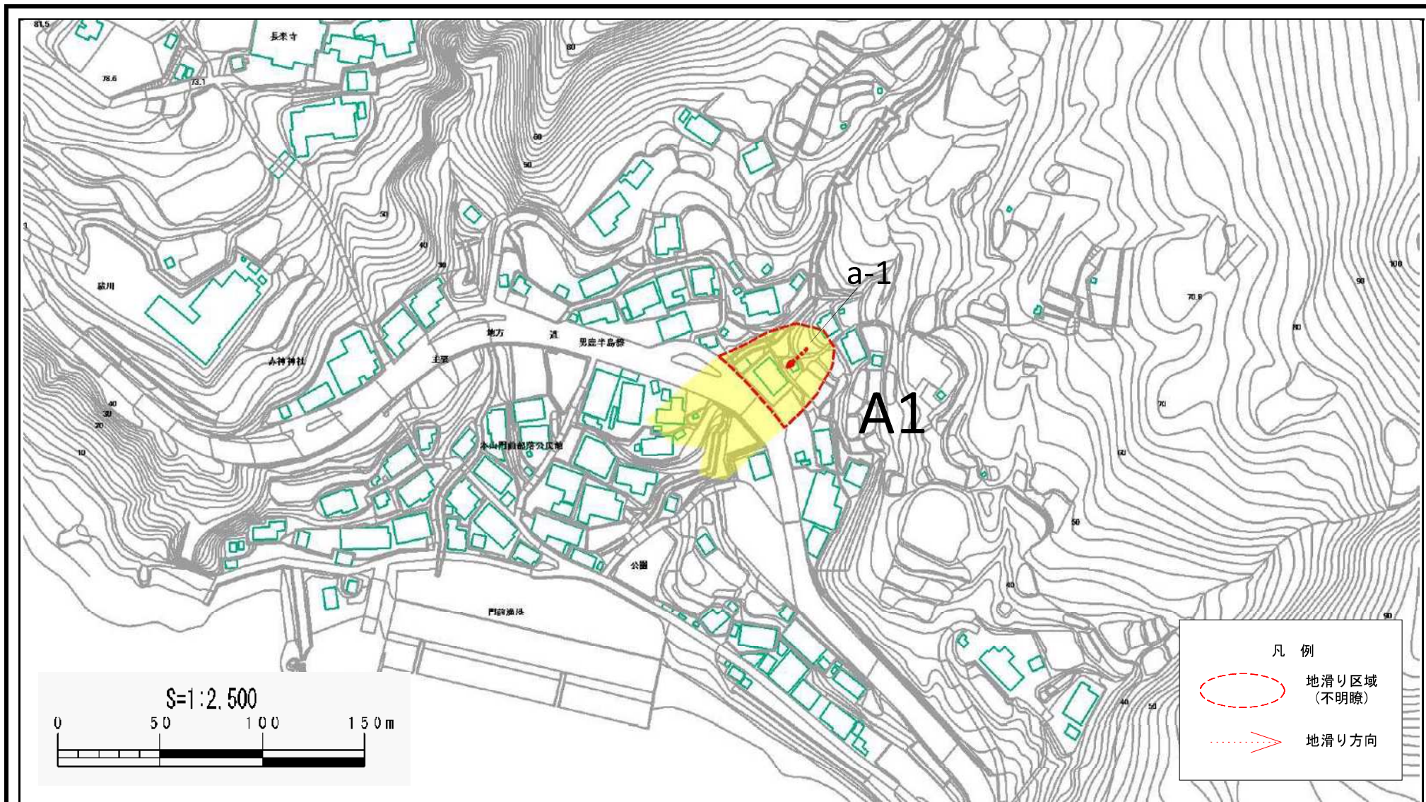
様式-2(地) 土砂災害警戒区域図